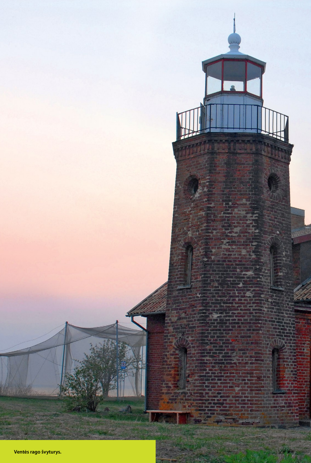
Ventės rago švyturys.